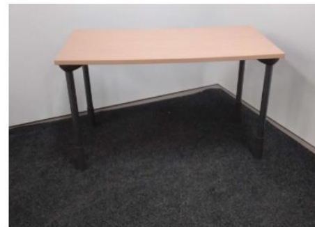
Pöytä 60 × 120 × 72 cm