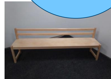
Penkki 35 × 169 × 61 cm